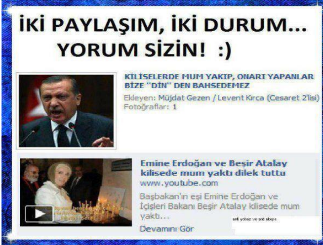
Resim 5: Hükümet üyelerinin kiliselerle ilgili düşüncesine verilen örneklerden

AKP iktidarının inançlarla ilgili attığı adımlar çok tartışılmaktadır. Ruhban Okulu, azınlık vakıflarının malları, İmam Hatip Liseleri, Aleviler’in ibadethaneleri ve din adamları üzerinden yapılan tartışmalar sık sık gündemi meşgul etmektedir. Farklı zamanlarda ve platformlarda inançla ilgili ifadeler hükümetin bu konudaki politikalarına çelişkili yaklaşılmasına neden olmaktadır. Kullanıcıların çelişkili ifade tespitleri ile ilgili yaptığı sık