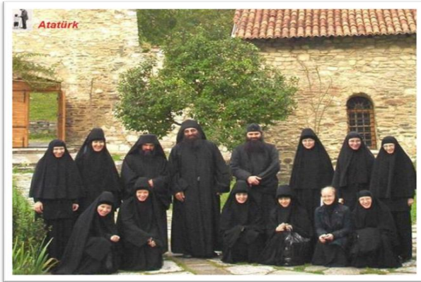
Resim 3: “İste kara çarşafın kökeni” 9

Kendini laik olarak tanımlayan kullanıcılar, İslam muhafazakârlarının, ‘inançlı bir Müslüman kadının siyah çarşaf kullanması zorunludur’ şeklinde düşündüklerini ifade ederek profillerinde özellikle kara çarşafın kökeni ile ilgili görselleri (Resim 3) sıklıkla paylaşmaktadırlar. Müslüman ve inançlı olmayı savunan muhafazakâr kesimlerin, İslamiyet ile ilgili olmayan hatta bu kesimlerin karşısında duran, başka bir din (Hıristiyan vb) ya da farklı bir ırk (İran vb.) vurgusu yaparak yaptırımların dinle alakalı olmadığını ifade etmektedirler.