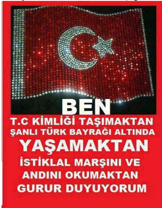
Resim 7: Bayrak, kimlik ve İstiklal marşı görseli

Kullanıcıların % 86'sı 'Türklük' kavramını, etnik olarak Türk olanlara mal etmemekte, ülkede yaşayan ve kendini öyle ifade edenleri de bu tanım içine sokmaktadır. Yani Türklük onlar için üst kimlik konumuna gelmiştir.