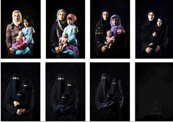
Resim 4: Boushra Almutawakel'in "Kadın ve Yok Oluş" isimli çalışması

Yemen’li fotoğraf sanatçısı Boushra Almutawakel’in “Kadın ve Yok Oluş” isimli çalışması (Resim 4) kadınlara siyah çarşaf giymeleri için yapılan zorlama ve telkinler karşısında kadının zaman içinde yok olacağını ifade etmektedir. Görselle ilgili yapılan yorumlar, eril bir dille ifade edilmektedir. Tezatlık eril dille kadın haklarını savunmak olsa da, din ve ahlak kuralları çerçevesinde yapılan “nasihat” ve “tavsiyeler”in kadını ve zamanla toplumu, kimliğini ve özünü kaybetmiş, özgürlükleri ve statüsü, sosyal kazançları elinden alınmış bir noktaya getireceği yönündedir.