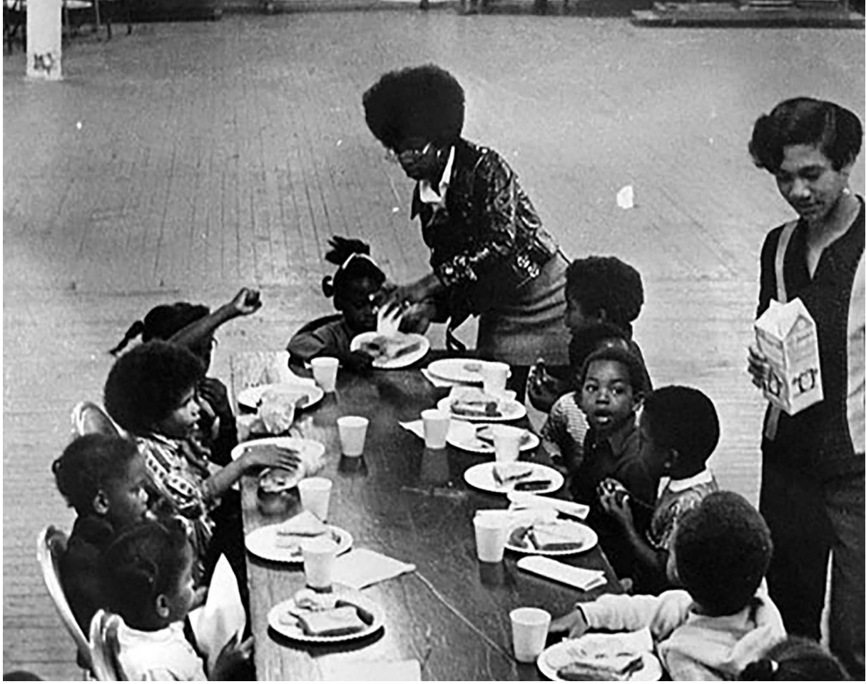
Resim 4: Kara Panterler Partisi'nin Faaliyetleri: Okul Çocukları İçin Bedava Kahvaltı Programı

Eylemci H. Rap Brown'un "Burn Baby Burn" (Yan Bebek Yan) sloganından hareketle yazılan ve Parti'nin gazetesinde sıklıkla kullanılan "Guns Baby Guns" (Silahlar Bebek Silahlar) şiiri, parti mensuplarının militan taraflarını ve silahla olan ilişkilerini açıkça ortaya koymaktadır.