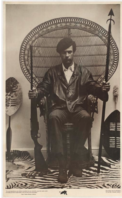
Resim 2- Kara Panterler Partisi'nin Kurucusu Dr. Huey P. Newton'un ikonik fotoğrafı